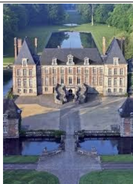
Société de Saint-Vincent-de-Paul Fondée par Frédéric Ozanam Fédération Française

Participation de 30€ - Inscription à l'Accueil (accompagnée du règlement par chèque à l'ordre de la «Conférence Saint Vincent de Paul»)